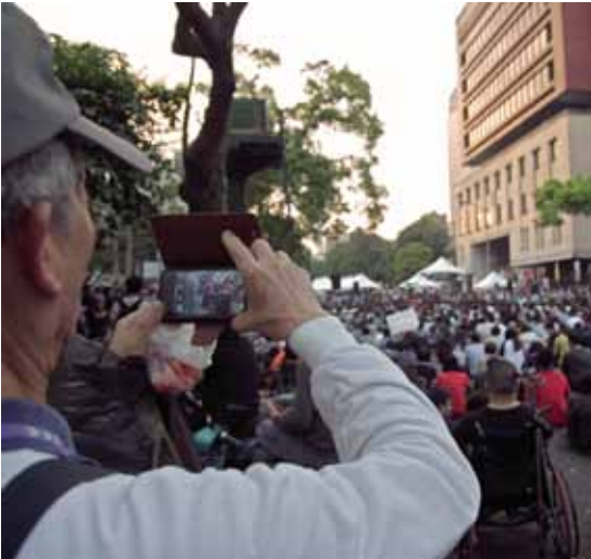
Mittendrin und live dabei: Nicht immer sind Handyvideos glaubwürdig. Die ARD prüft solche Filme, bevor sie sie sendet.