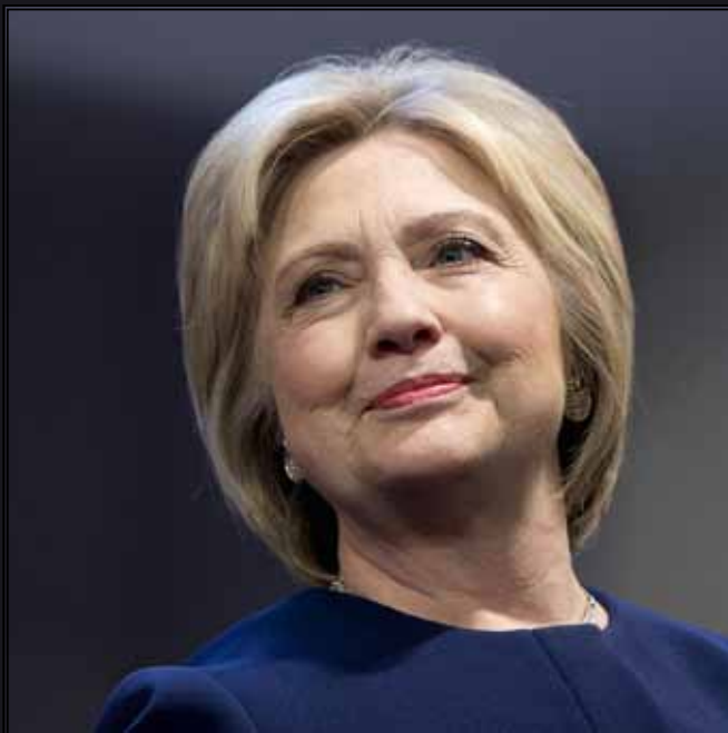
Hillary Clinton kennt das Weiße Haus bereits aus ihrer Zeit als First Lady an der Seite von Bill Clinton. Jetzt will die Methodistin und Demokratin selbst Präsidentin werden.

Demokraten und ehemalige Außenministerin 2015 beim Jahrestreffen der Frauenbewegung United Methodist Women Assembly, „eine Anwältin zu sein für Kinder und Familien, für Frauen und Männer weltweit, die unterdrückt und verfolgt werden, und denen die Menschenrechte und Menschenwürde bestritten werden“.