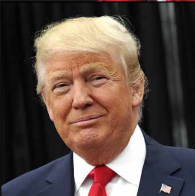
Präsidentenskandidat Donald Trump findet seine christliche Religion „wunderbar“. Mit Bibelwissen konnte der Republikaner bislang jedoch nicht aufwarten.

Hillary Clinton, die Betende, gehört der methodistischen Kirche an, für die soziales Engagement wichtiger ist als der Disput um theologische Feinheiten. Ihr Glaube leite sie, so die Kandidatin der